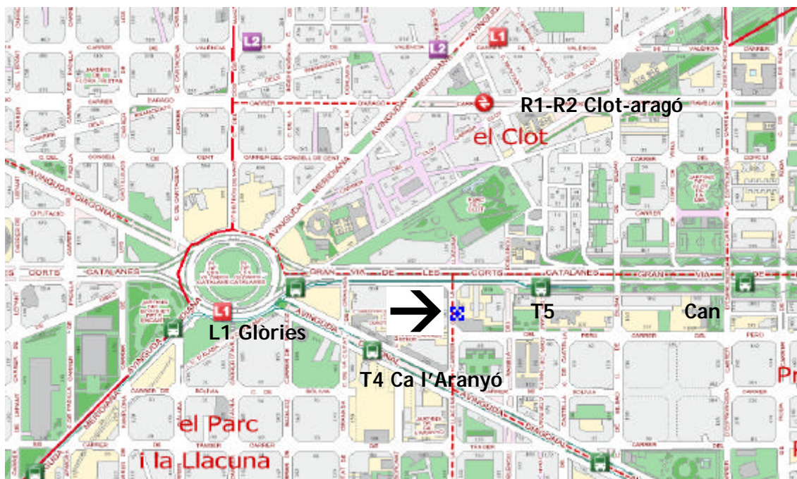
Ubicació de l'Auditori Barcelona Activa al 22@

L'Auditori Barcelona Activa està situat al carrer Llacuna 162-164 , al districte 22@ de Barcelona. Podeu accedir còmodament en transport públic a través del Metro L1: Glòries; Rodalies R1-R2: Clot-Aragó; Tram T5: Can Jaumandreu i Tram T4: Ca l'Aranyó; Bus: 7, 56, 60, 92, B21.